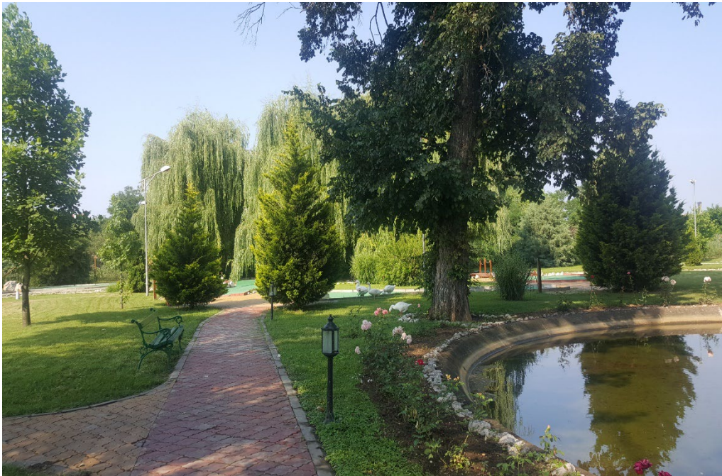
Слика 3. СРЦ Попова плажа – минигольф терен