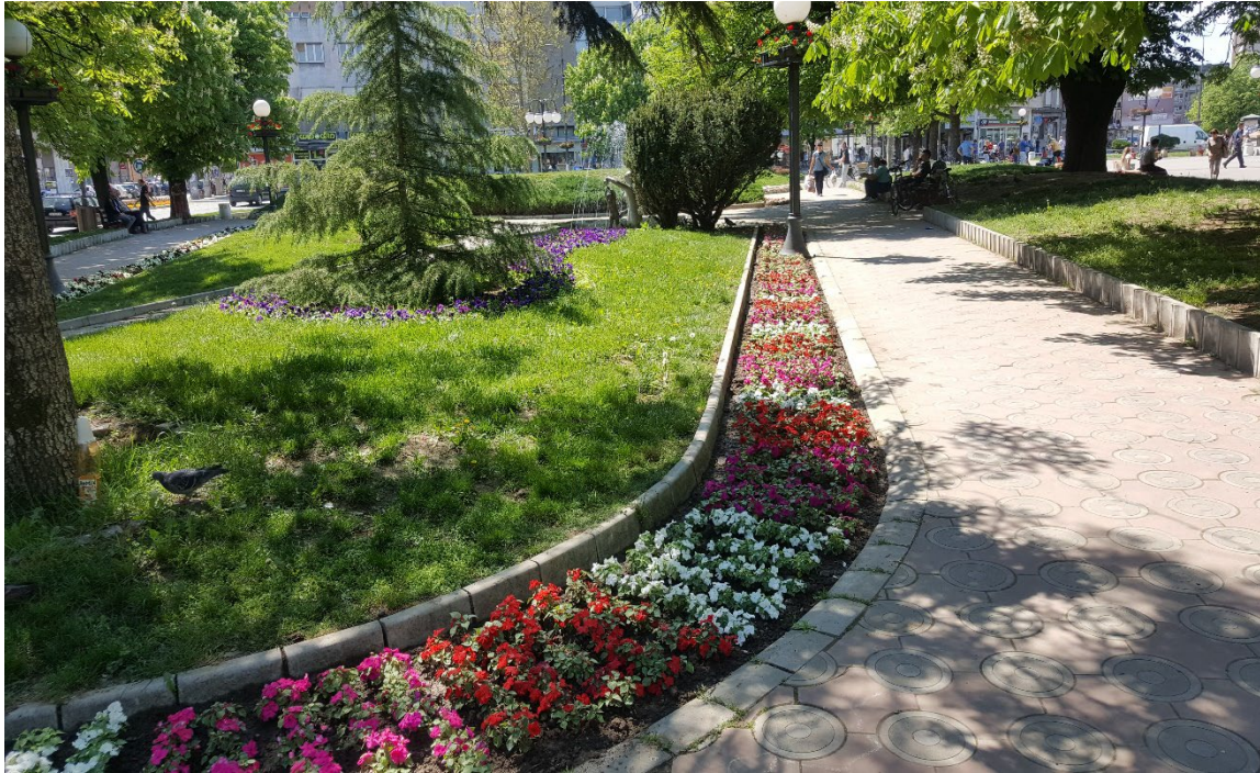
Слика 2. Трг ослобођења